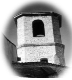
JONQUIERES St Mappalice