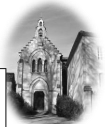
CAUSANS St Martin

Feuille n°52 – Année C Fête de la Sainte Famille Dimanche 29 Décembre 2024