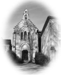
CAUSANS St Martin

Feuille n°49– Année C 2 ème dimanche de l'Avent 8 décembre 2024