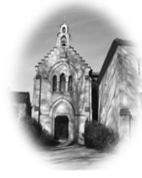
CAUSANS St Martin

Feuille n°46– Année B 33 ème dimanche du temps ordinaire 17 novembre 2024