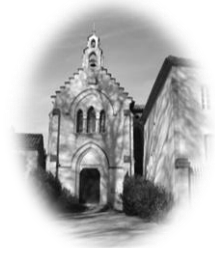
CAUSANS St Martin

Feuille n°45– Année B 32 ème dimanche du temps ordinaire 10 novembre 2024