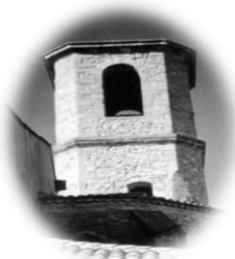
JONQUIERES St Mappalice