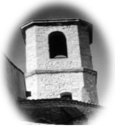
JONQUIERES St Mappalice