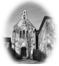
CAUSANS St Martin

Feuille n°1 – Année C Fête de l'Épiphanie Dimanche 5 Janvier 2025