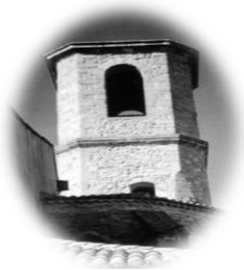
JONQUIERES St Mappalice