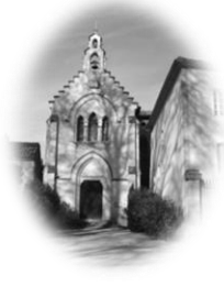
CAUSANS St Martin

Feuille n°11– Année C 3 ème Dimanche de Carême 23 mars 2025